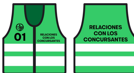
Chaleco identificativo Relaciones con los concursantes